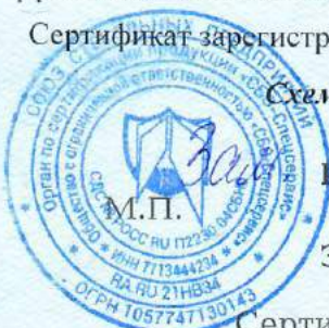
Схема сертификации 1с (ГОСТ Р 53603-2009)

Сертификат зарегистрирован на сайте СДС № РОСС RU.П2230.04СБНО www.sbossp.ru